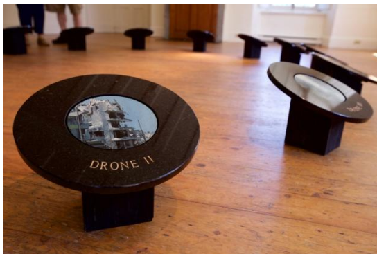
Drone I à XIV

Paul Béliveau a plus d'une centaine d'expositions solos à travers le Canada, les États-Unis et l'Europe à son actif. Il est représenté par des galeries à Montréal, Vancouver, Boston, New York, Londres et Stockholm. Ses œuvres font partie de plusieurs collections publiques et privées dont Air Canada, Pratt & Whitney, Loto-Québec, le Musée d'art contemporain de Montréal et le Musée national des beaux-arts du Québec.