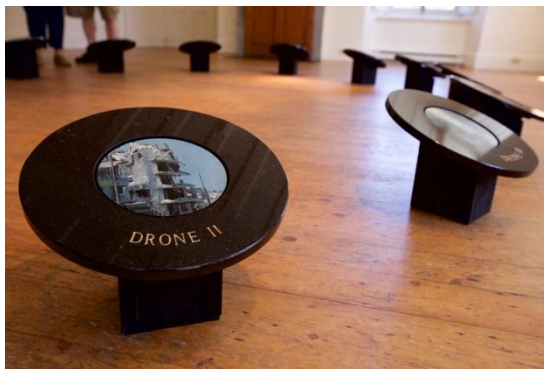
Drone I à XIV

Paul Béliveau a plus d'une centaine d'expositions solos à travers le Canada, les États-Unis et l'Europe à son actif. Il est représenté par des galeries à Montréal, Vancouver, Boston, New York, Londres et Stockholm. Ses œuvres font partie de plusieurs collections publiques et privées dont Air Canada, Pratt & Whitney, Loto-Québec, le Musée d'art contemporain de Montréal et le Musée national des beaux-arts du Québec.