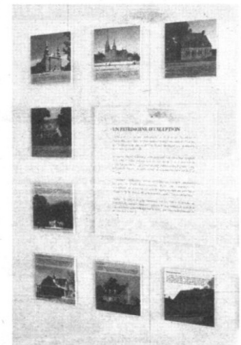
Quelques images de l'exposition qui témoignent d'un patrimoine d'exception.

partir de n'importe quel ordinateur ( www.culture-patrimoine-deschambault-grondines.ca ), annonce M. Vézina. Nous allons très loin dans le conseil technique et les données seront mises à jour régulièrement.» Éventuellement, une matricule s'ajoutera à l'exposition, de même qu'une section consacrée à des ouvrages de référence. « Un art d'habiter , c'est aussi l'occasion de sensibiliser, tranquillement, les citoyens au patrimoine paysager, un défi complémentaire à celui des bâtiments, puisque l'environnement dans lequel ceux-ci prennent place compte pour beaucoup dans l'harmonie des lieux», termine celui qui souhaite que l'exposition serve de modèle ailleurs au Québec.