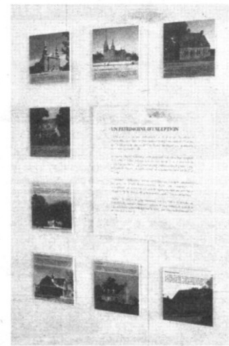
Quelques images de l'exposition qui témoignent d'un patrimoine d'exception.

L'organisme Culture et Patrimoine Deschambault-Grondines a profité de l'inauguration d' Un art d'habiter pour lancer un tiré à part extrait de la revue Continuité publiée par le Conseil des monuments et sites du Québec. Sous le titre Deschambault-Grondines, de mémoire et d'audace, le document de huit pages contient trois articles et de nombreuses illustrations montrant la richesse du patrimoine architectural des deux villages. Les textes permettent en fait au lecteur de s'imprégner de l'esprit qui anime les citoyens engagés dans l'action patrimoniale et culturelle des lieux depuis 40 ans. Le document a été imprimé à 3000 exemplaires et a été distribué dans tous les foyers de la municipalité de même qu'à différents endroits à l'échelle de la MRC de Portneuf. Johanne Martin (collaboration spéciale)